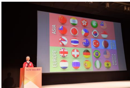
Image1: ACTE による参加者紹介

カンファレンスには、2日間で21か国から280社、528名が参加しました。キーノート・スピーチには日本政府観光局(JNTO)理事長の松山良一氏、公益財団法人東京オリンピック・パラリンピック競技大会組織委員会から鈴木秀典氏らが登壇しました。