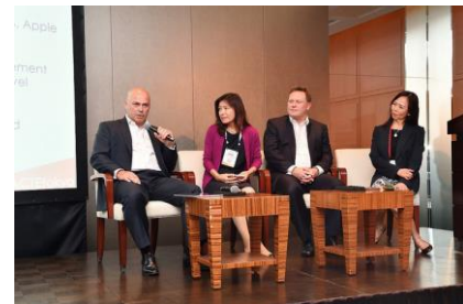
Image5: ラーニングセッション